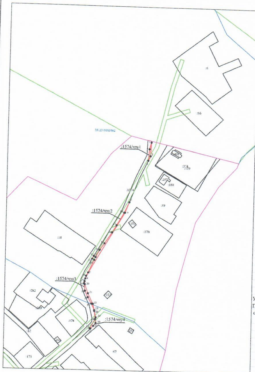
Схема границ земель или части земельного участка на кадастровом плане территории для размещения объекта: Распределительные газопровод в д. Камешник, Шекснинского района до земельного участка с кадастровым номером 35:23:0101002:6