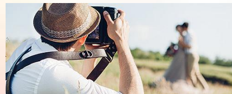
Фото- и видеосъемка на заказ

Удаленная работа через электронные площадки