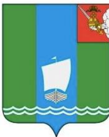
Схема водоснабжения и водоотведения СЕЛЬСКОГО ПОСЕЛЕНИЯ ЧЁБСАРСКОЕ ШЕКСНИНСКОГО МУНИЦИПАЛЬНОГО РАЙОНА ВОЛОГОДСКОЙ ОБЛАСТИ На период 2022-2029 гг. (Актуализированная редакция)