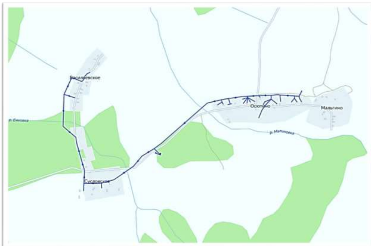
Рис.2. Схема водоснабжения д. Осютино, д. Суловское, д. Васильевское.

Предписания органов, осуществляющих государственный надзор, муниципальный контроль, об устранении нарушений, влияющих на качество и безопасность воды, в настоящее время отсутствуют.