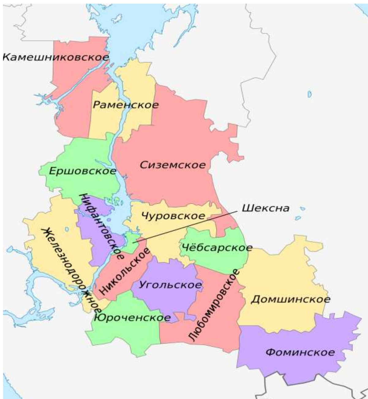
Рис.1. Схема границы Шекснинского муниципального района

Главной водной артерией является река Шексна, другие наиболее крупные впадают в неё. Среди них: Угла, Ковжа, Жилая Мушня, Сизьма, Лапсарь, Улома, Чернуха, Божай, Чурова, Чуровка, Судебка, Пишковка, Имая, Роица, Издова, Пажба, Чебсара и другие. Река Шексна вытекает из озера Белое и впадает в Шекснинский залив Рыбинского водохранилища. В районе бассейна Шексны более 100 озер и 2 водохранилища: Шекснинское и Рыбинское.