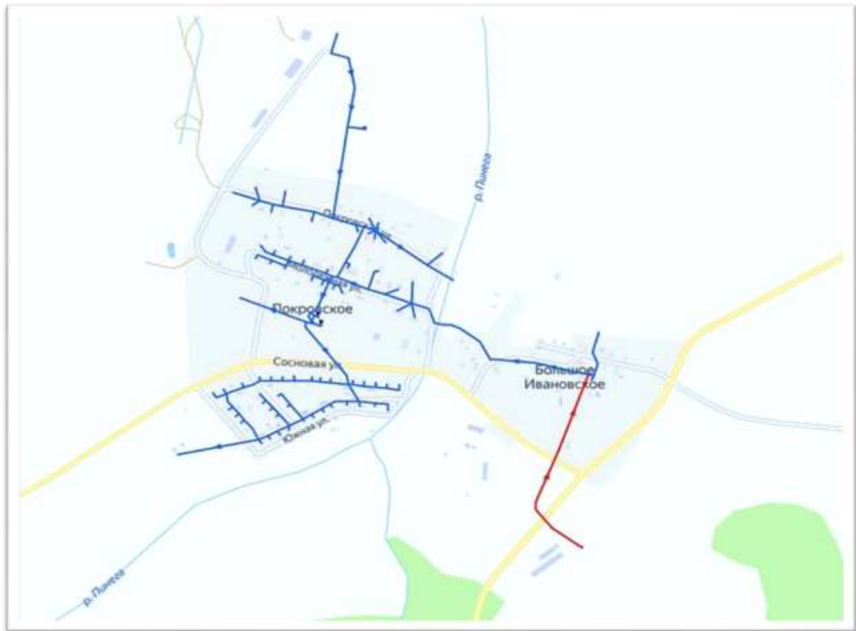
Рис.3. Схема водоснабжения д. Покровское, Большое Ивановское.

Описание централизованной системы горячего водоснабжения с использованием закрытых систем горячего водоснабжения, отражающее технологические особенности указанной системы.